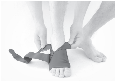
1. PL: Załóż ortezę na nogę. EN: Put the brace on the leg.