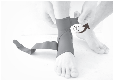
2. PL: Zapnij rzep (1) EN: Fasten the Velcro (1)