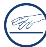
PRZYJAZNY DLA SKÓRY