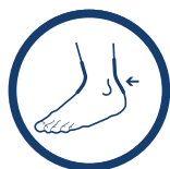
ORTEZA STAWU SKOKOWEGO

Stabilizator AM-OSS-12 firmy Reh4Mat został tak zaprojektowany aby sprostać najwyższym wymaganiom jakie stawiają osoby aktywne ortezom stawu skokowego. Dzięki zastosowaniu dynamicznego surowca i cienkiej konstrukcji pasuje do wszystkich rodzajów obuwia, także do obuwia sportowego. Orteza zawiera obustronne, anatomicznie wyprofilowane elementy usztywniające wbudowane wewnątrz stabilizatora.