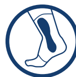
3OCZNE ANATOMICZNE WZMOCNIENIA