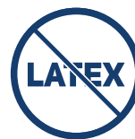
WOLNY OD LATEKSU