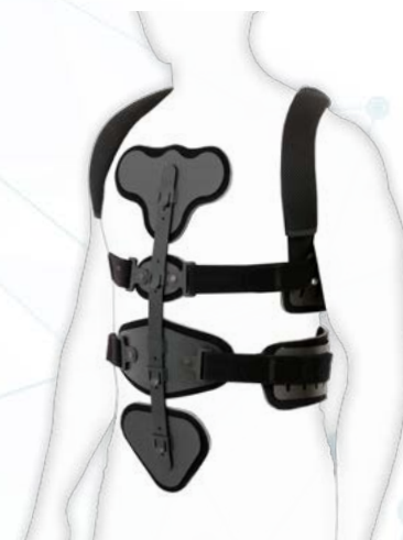
MS-T-02/ TLSO +

Gorsety MS-T-02 z serii SPINEfit składają się z elementów elastycznych łatwo dopasowujących się do figury pacjenta. Zbudowane są z bardzo cienkiego materiału, co powoduje, że są wyjątkowo komfortowe w użytkowaniu. Dodatkowo gorsety te posiadają modułowy przyrostowy bądź ubytkowy poziom stabilizacji, w zależności od potrzeb pacjenta i jego postępów w rekonwalescencji. Dzięki systemowi modułarnemu można rozbudowywać bądź zawężać ich konstrukcję.