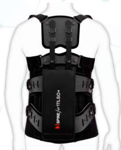
MS-T-01/ TLSO +

Elementem kompresyjnym gorsetów MS-T-01 jest elastyczna, doskonale dopasowująca się do ciała pacjenta orteza lędźwiowo-piersiowa, wykonana z wysokiej jakości gumy ortopedycznej Air Rubber , wyposażona w fiszbiny i stalki ortopedyczne, zapięcia przednie oraz tylny system regulacji obwodowej.