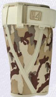
ANATOMICZNA ORTEZA UDA