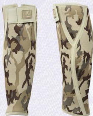
ANATOMICZNA ORTEZA PODUDZIA

To jest wyrób medyczny. Używaj go zgodnie z instrukcją używania lub etykietą.