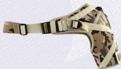
ANATOMICZNA ORTEZA BARKU