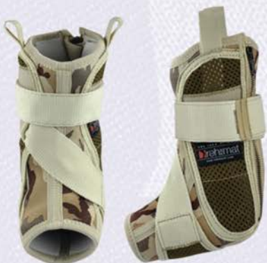
ORTEZA STAWU SKOKOWEGO Z ŁUSKAMI ANATOMICZNYMI I PASEM SPIRALNYM