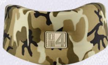
KOŁNIERZ MIĘKKI TYPU SHANTZA