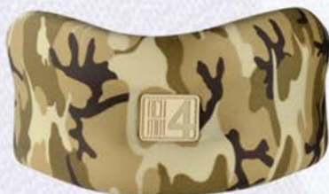
KOŁNIERZ PÓŁSZTYWNY TYPU FLORIDA

To jest wyrób medyczny. Używaj go zgodnie z instrukcją używania lub etykietą.