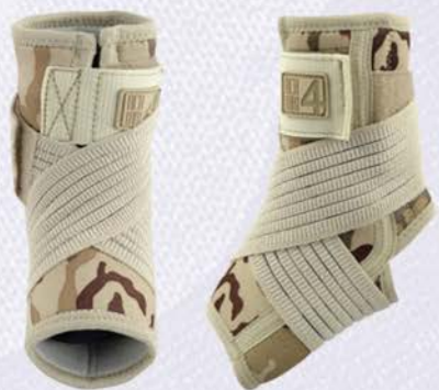
ORTEZA STAWU SKOKOWEGO Z PASAMI KRZYŻOWYMI