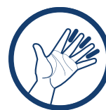
SEPARATOR PALCÓW DŁONI