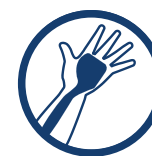
ANATOMICZNY SZYNA DŁONIOWA