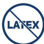
WOLNY OD LATEKSU