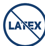
WOLNY OD LATEKSU