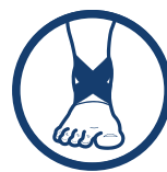
ÓSEMkowe PASY KRZYŻOWE