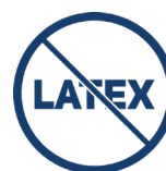
WOLNY OD LATEKSU