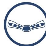
SZYNA Z REGULACJĄ RUCHOMOŚCI 2R

www.reh4mat.com e-mail: biuro@reh4mat.com