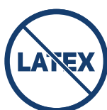
WOLNY OD LATEKSU