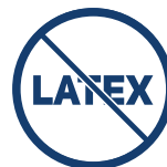
WOLNY OD LATEKSU

www.reh4mat.com e-mail: biuro@reh4mat.com