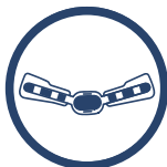
SZYNA Z REGULACJĄ RUCHOMOŚCI 2R