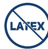
WOLNY OD LATEKSU

www.reh4mat.com e-mail: biuro@reh4mat.com