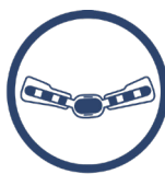
SZYNA Z REGULACJĄ RUCHOMOŚCI 2R