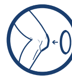
ANATOMICZNY PIERŚCIEŃ OKOŁORZEPKOWY