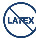
WOLNY OD LATEKSU