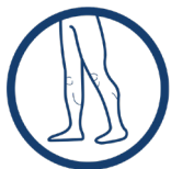
ORTEZA KOŃCZYNY DOLNEJ

Orteza podrzepkowa EB-P/RZ została wykonana z najlepszych materiałów. Odciąża ona przyczep końcowy mięśnia czworogłowego uda, niwelując tym samym jego wzmożone napięcie. Dzięki temu, stabilizuje i odciąża rzepkę, zapobiegając bólom w stawie rzepkowo-udowym oraz jej degeneracji. Do ortezy zamontowano pelotę silikonową o anatomicznym kształcie, która doskonale obejmuje więzadło rzepki, a jej półsztywna konstrukcja zapewnia prawidłowe odciążenie.