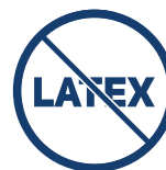
WOLNA OD LATEKSU