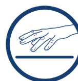
PRZYJAZNY DLA SKÓRY