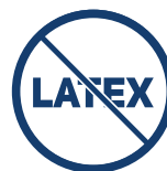
WOLNA OD LATEKSU