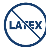
WOLNY OD LATEKSU