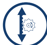
SZEROKI ZAKRES REGULACJI