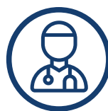
POLECANY PRZEZ SPECJALISTÓW