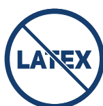
WOLNY OD LATEKSU