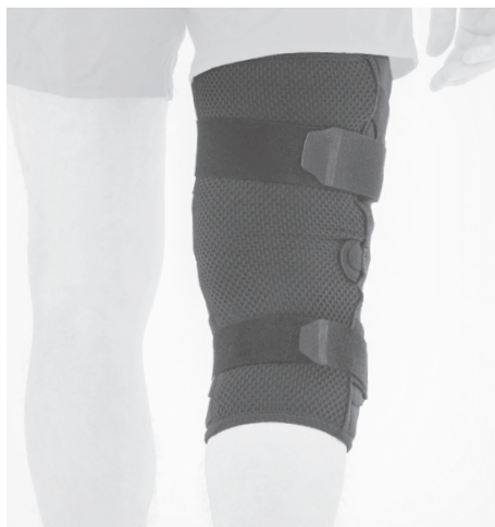
PL: MOCNA STABILIZACJA EN: STRONG STABILIZATION