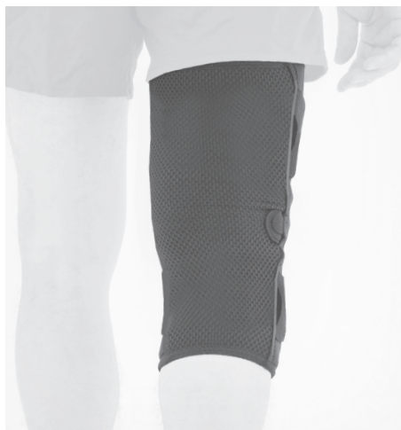
SŁABA STABILIZACJA POOR STABILIZATION.