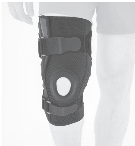
3. PL: Gotowy wyrób. EN: Product is ready to use.