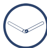
SZYNA MAGNETYCZNA 1R ORTHODESIGN