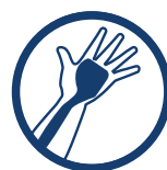
ANATOMICZNY SZYNA DŁONIOWA