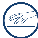
PRZYJAZNY DLA SKÓRY