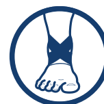
ÓSEMkowe PASY KRZYŻOWE

www.reh4mat.com e-mail: biuro@reh4mat.com