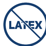
WOLNY OD LATEKSU