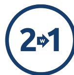
2 W 1