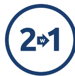
2 W 1