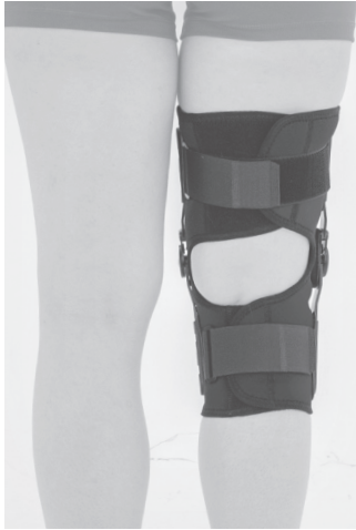
4. PL: Gotowy wyrób. EN: Product is ready to use.