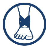
ÓSEMKOWE PASY KRZYŻOWE