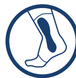
BOCZNE ANATOMICZNE WZMOCNIENIA