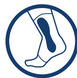
BOCZNE ANATOMICZNE WZMOCNIENIA