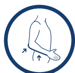
ORTEZA ŁOKCIA I PRZEDRAMIENIA