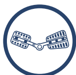
SZYNA Z REGULACJĄ RUCHOMOŚCI RE