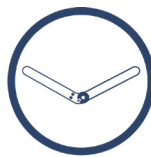
SZYNA MAGNETYCZNA 1R ORTHODESIGN