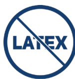
WOLNY OD LATEKSU