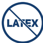
WOLNY OD LATEKSU