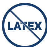
WOLNY OD LATEKSU