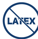
WOLNY OD LATEKSU