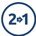
2 W 1