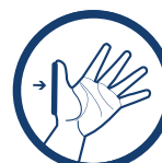
ANATOMICZNA SZYNA KCIUKA

www.reh4mat.com e-mail: biuro@reh4mat.com