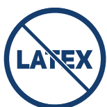
WOLNY OD LATEKSU