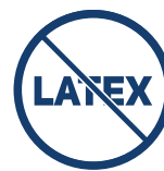
WOLNY OD LATEKSU

www.reh4mat.com e-mail: biuro@reh4mat.com