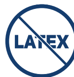
WOLNA OD LATEKSU