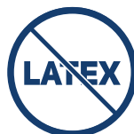
WOLNY OD LATEKSU