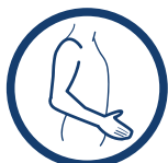
ORTEZA KOŃCZYNY GÓRNEJ

OKG-01 posiada bardzo innowacyjną konstrukcję. Może być stosowany zarówno na prawą jak i lewą rękę. Specjalna konstrukcja produktu pozwala na ustawienie kończyny górnej w dwóch terapeutycznych pozycjach.