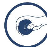
PIŁECZKA DO ĆWICZEŃ

www.reh4mat.com e-mail: biuro@reh4mat.com