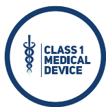
WYRÓB MEDYCZNY KL. I