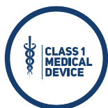
WYRÓB MEDYCZNY KL. I