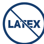
WOLNY OD LATEKSU