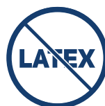
WOLNY OD LATEKSU