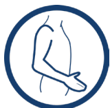
ORTEZA KOŃCZYNY GÓRNEJ

OKG-07 to komfortowa podwieszka kończyny górnej wyposażona w element termoformowany, który znacznie poprawia użytkowanie tego typu temblaka i wyróżnia go spośród konkurencyjnych wyrobów. OKG-07 stosowany jest w przypadku konieczności stabilizacji lub unieruchomienia kończyny górnej oraz odciążenia stawu barkowego będących następstwem złamania. Doskonale stabilizuje kończynę zaopatrzoną w opatrunek gipsowy lub dodatkową ortezę stawu nadgarstkowego.